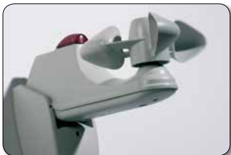
Sol- og vindvakt

Automatisk solskjerming blir en effektiv del av boligens komfortstyring og gir deg en følelse av luksus i hverdagen. Og ikke er det spesielt dyrt heller – driftskostnaden for en automatisk screen er bare noen kroner i året.